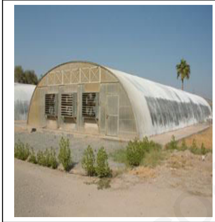
الوثيقة - 2 -