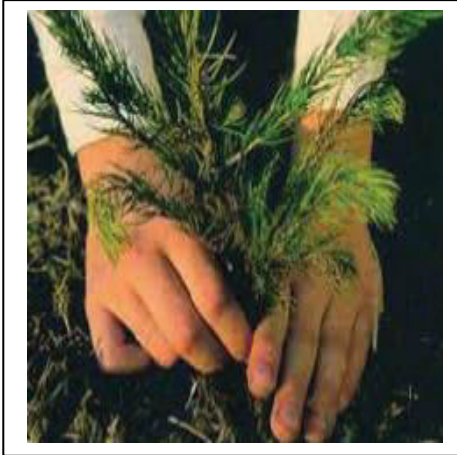
الوثيقة - 3 -