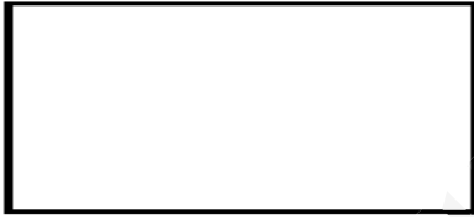
- مخطط الدارة -